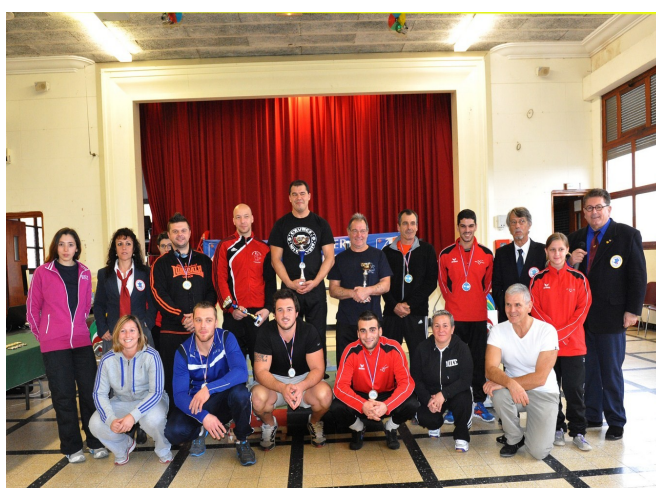
Les participants au Critérium en Force Athlétique