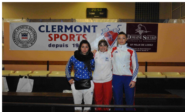
.....et chez les femmes

C'est dans une ambiance chaleureuse et devant un public venu nombreux que les athlètes invités pour cette 10 ème édition du Tournoi International ont évolués.