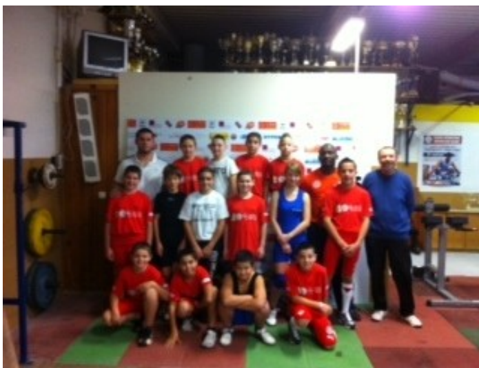
Le groupe des stagiaires ainsi que les entraîneurs

La deuxième séance fut plus axée sur le travail technique en préparation au Challenge de l'Avenir qui aura lieu le Samedi 24 Novembre à Narbonne, avec toutes les améliorations qui peuvent être apportées sur la gestuelle.