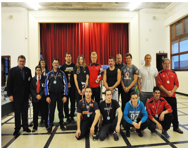
Le groupe des athlètes débutants en Développé-Couché

Vous pouvez consulter les feuilles de match sur le site du Comité Régional.