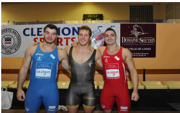
Le podium 100% français chez les hommes