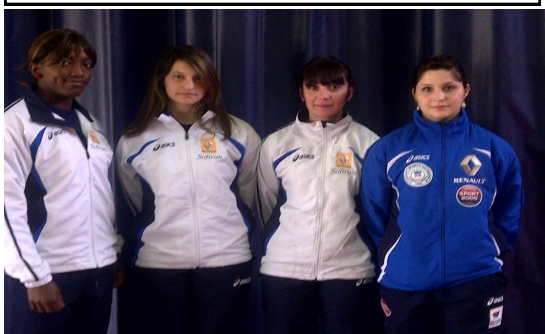
Les Féminines de Clermont Sports

Enfin les Féminines de Clermont Sports, championnes de France en titre, venaient pour assurer leur place en Finale avec un total rond de 200pts. Elles emportent bien sûr la Finale de Zone et se qualifient pour la Finale Nationale avec la deuxième place derrière une « surprenante » équipe de Strasbourg.