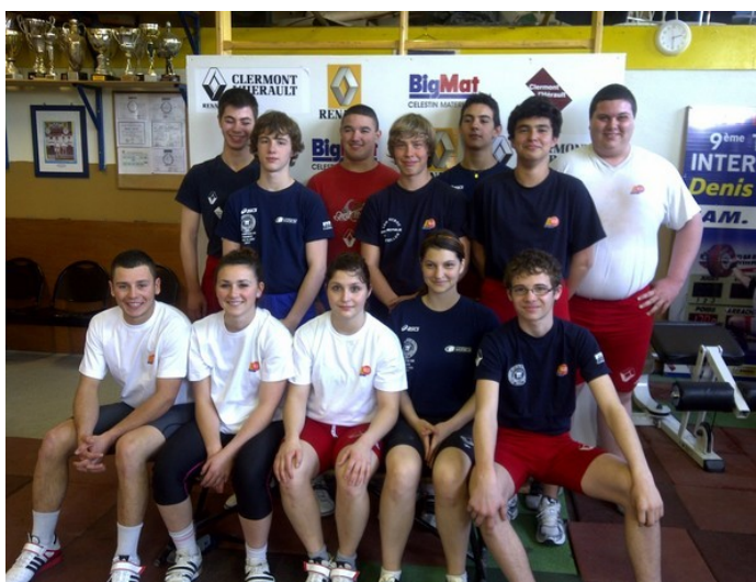
Le groupe des stagiaires avec pas moins de 10 qualifiés en Finale Nationale

Le point a également été fait sur les objectifs individuels et sur le chemin restant à parcourir pour le très haut niveau.