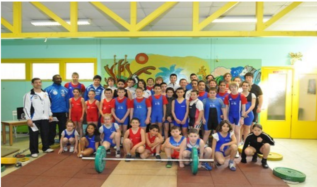
Les participants lors de cette journée record

Nous espérons encore voir de nouvelles têtes pour les prochaines éditions de ce beau Challenge de l'Avenir.