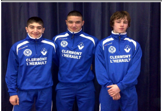
Les Cadets de Clermont Sports