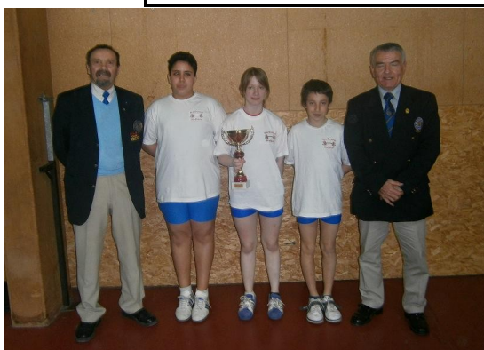
Les minimes mixte de Narbonne Haltéro

C'est à Anse dans la banlieue lyonnaise qu'avait lieu la 2 e me Journée du Championnat de France des Clubs Jeunes ainsi que la Finale de Zone des Cadets et Juniors.