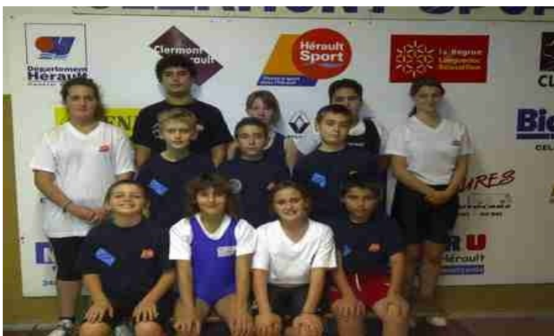
Le groupe des stagiaires lors de regroupement du 5 Novembre.

Le prochain stage aura lieu le 3 Décembre pour les Cadets et Juniors, et le 14 Janvier pour nos Benjamins et Minimes.