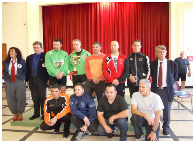
Les athlètes récompensés en seniors Masters

Le critérium des espoirs en DC se tenait dans le tout nouveau club de Arzens, où 25 athlètes se rencontrèrent.