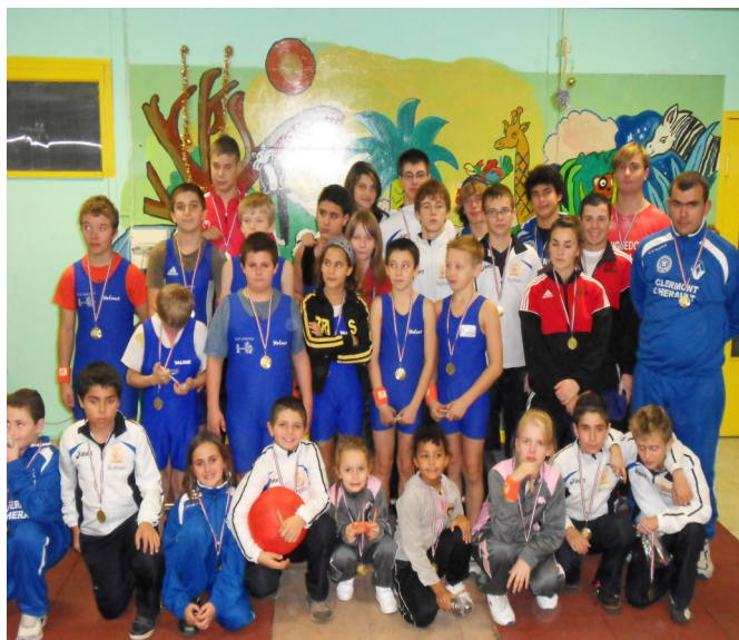
Le groupe des athlètes lors de la remise des récompenses

La prochaine étape de Challenge aura lieu le 21 Janvier 2012 à Clermont-l'Hérault.