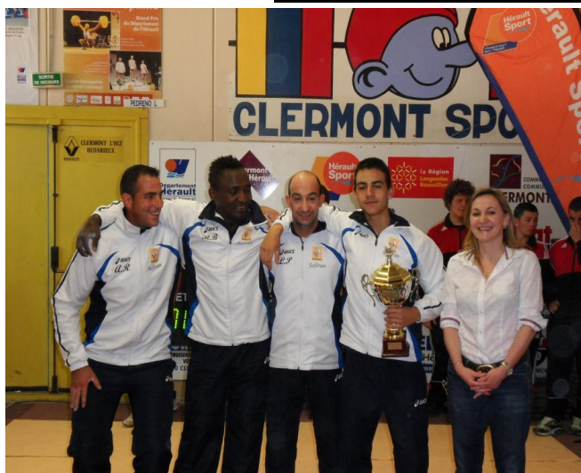
L'Equipe vainqueur de ce Championnat Interrégional 2010-2011

Troisième et dernière Journée du Championnat Interrégional qui avait lieu à Clermont-l'Hérault où l'on a vu la victoire de l'équipe B de Clermont Sports.